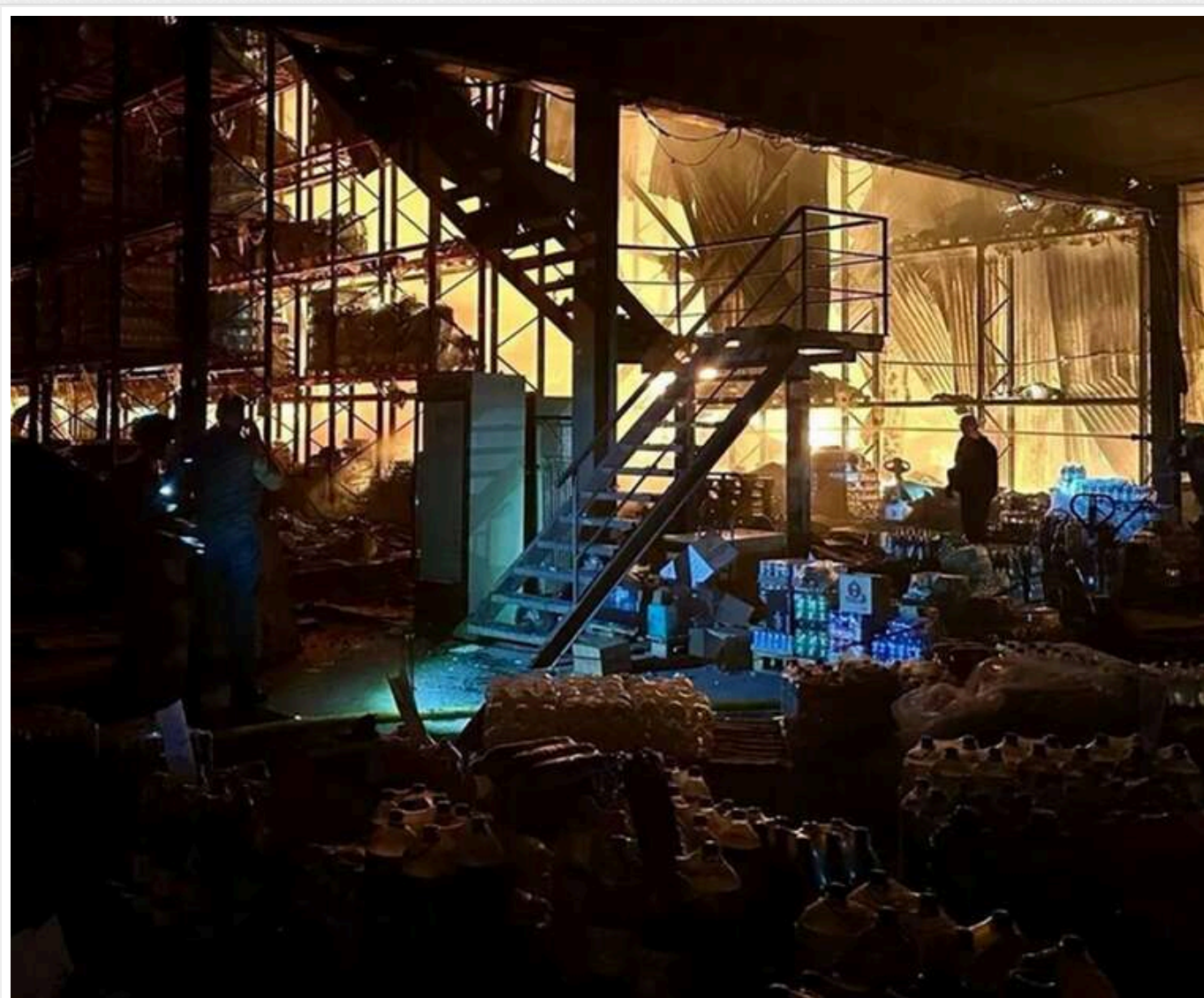
Росія вдарила балістикою по Дніпру: понівечено продуктивні склади, кількість постраждалих зросла до п'яти

У ніч з вівторка на середу, 20 травня, російські війська вкотре обстріляли Дніпро. Окупанти завдали удару балістичною ракетою, внаслідок чого пролунав потужний вибух. Наразі є дані про щонайменше п'ятьох постраждалих.