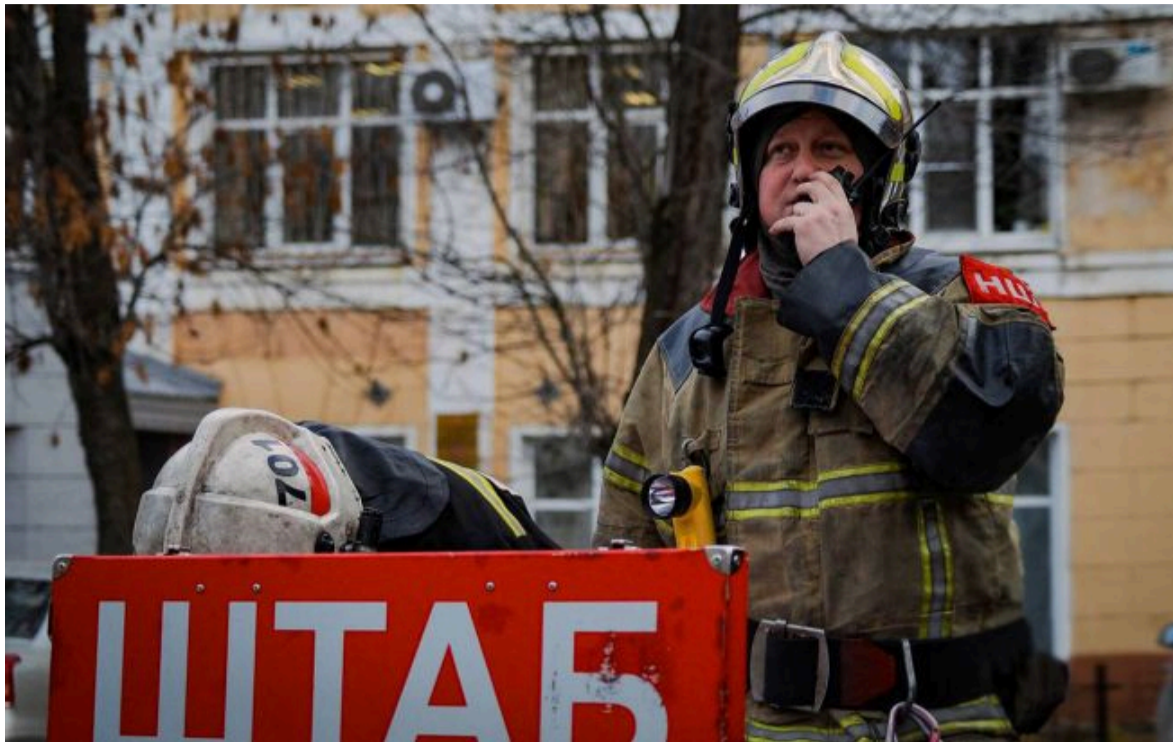
Фото: значна частина продукції використовується для виготовлення вибухівки

Вимкни хаос міжнародних новин! Отримуй тільки важливе з РБК-Україна у Google