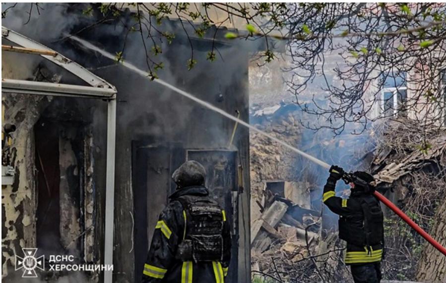
Ліквідація наслідків російського обстрілу в Херсоні