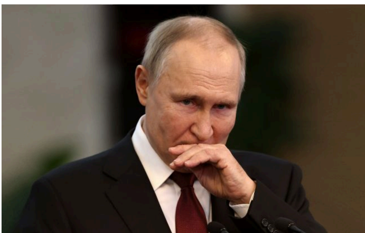
Фото: диктатор РФ Путін (Getty Images)

Вимкни хаос міжнародних новин! Отримуй тільки важливе з РБК-Україна у Google