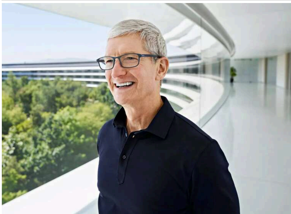
Тім Кук залишає посаду CEO Apple: компанію очолить Джон Тернус

Тім Кук залишить посаду генерального директора Apple.