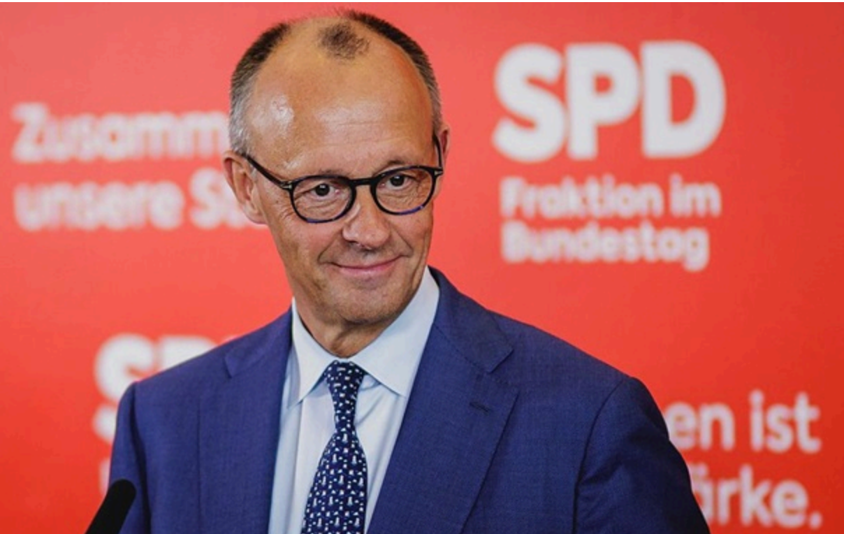
Канцлер ФРН зробив відповідну заяву на тлі візиту Путіна в КНР

Німецький канцлера не чекає змін у стратегічних відносинах між Росією та Китаєм, але має надію на вплив на Москву з боку Пекіна.