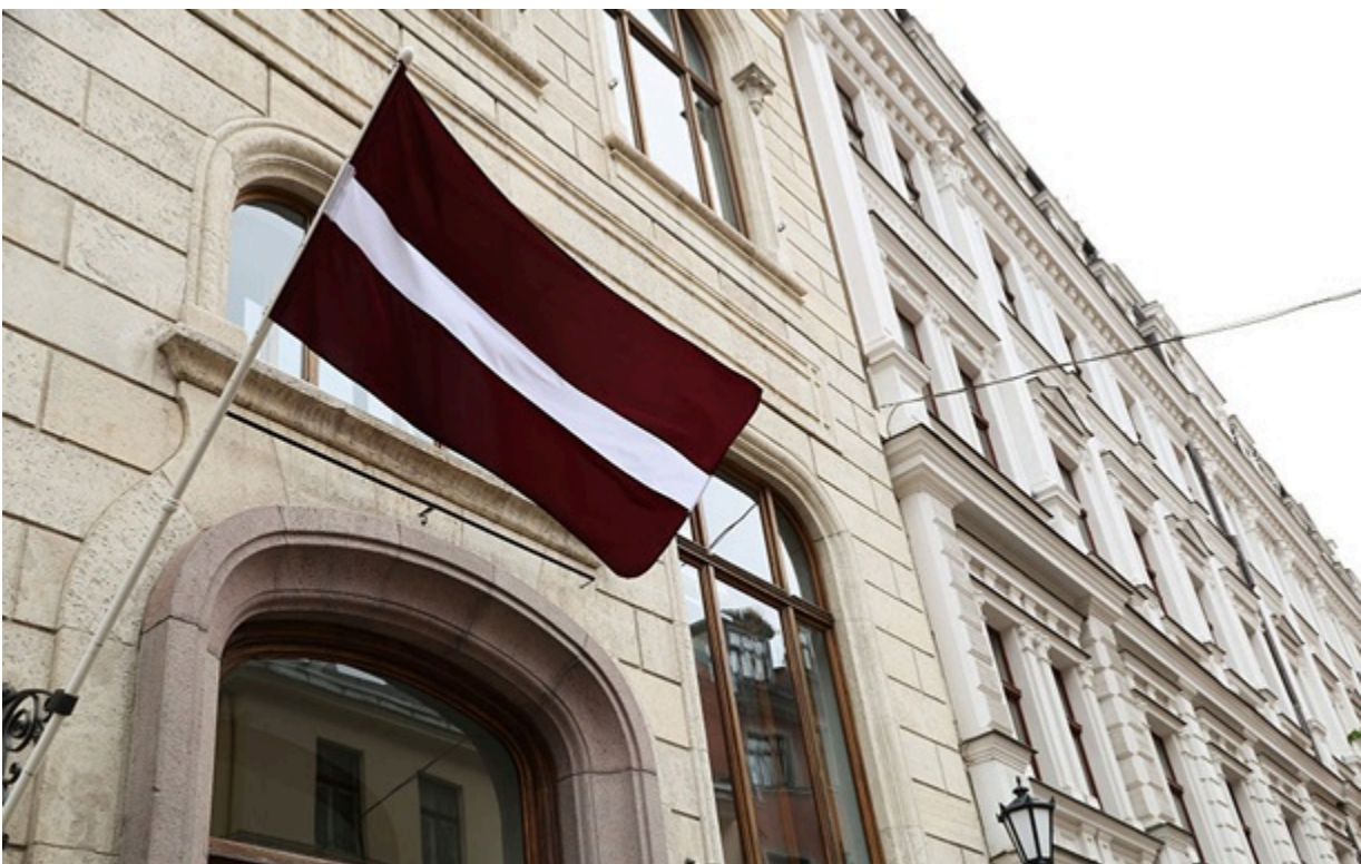
Міністерство закордонних справ Латвії 19 травня викликало російського дипломата у зв'язку з поширеною дезінформацією

Україна не використовує територію чи повітряний простір Латвії у своїх операціях проти Росії і не має наміру цього робити.