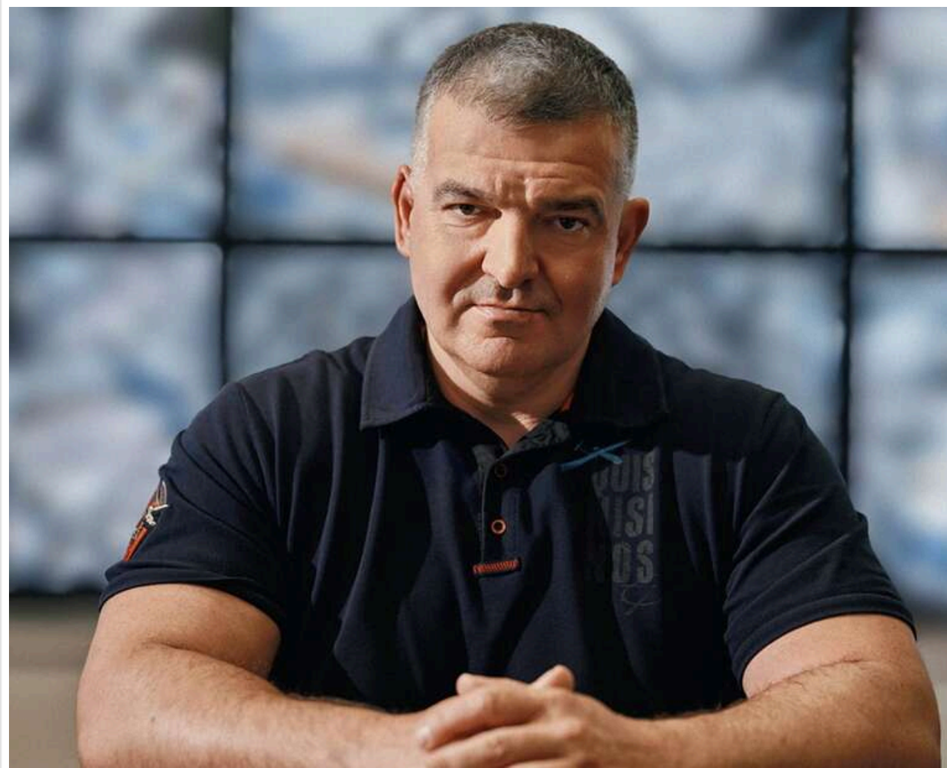
У ЦПК спростували звинувачення керівника Fire Point Штілєрмана щодо «зливу» ракетної документації посольствам

Нове інтерв'ю „власника“ Fire Point Дениса Штілєрмана.