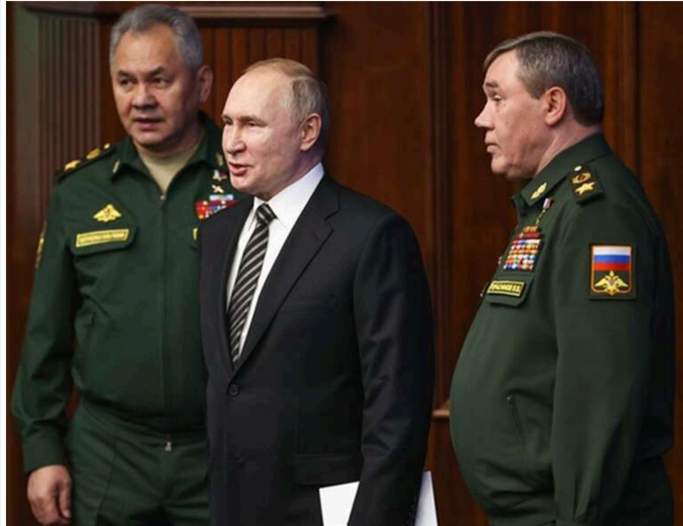
Тактична перевага ЗСУ та втрата темпу РФ: літо покаже, чи зможе Україна досягти стратегічного перелому, — WSJ

Українські сили змогли нейтралізувати чисельно переважаючу російську армію, здобувши відчутну перевагу як у тактиці, так і в технологічному оснащенні на суші та в повітрі.