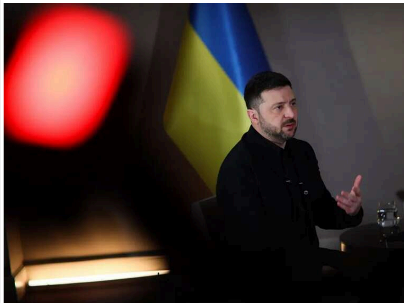
Зеленський заявив про зміну динаміки війни на користь України та затвердив плани далекобійних ударів на червень

За останній місяць помітні позитивні зрушення у перебігу бойових дій на користь України: українські війська втримують більше рубежів і завдають відчутніших ударів. Далекобійні атаки по території РФ мають значний вплив.