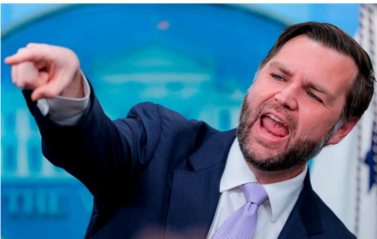
Передача іранського урану Росії ніколи не входила до планів США, заявив Венс

Подібна домовленість спровокує опір як з боку Вашингтона, так і з боку Тегерана, припустив урядовець.