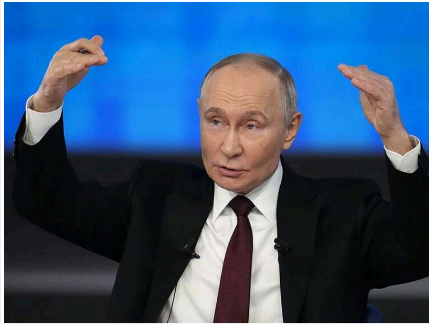
Розкол серед Z-патріотів: російські блогери та пропагандисти почали відкрито обговорювати наступників Путіна

Невдачі Росії у війні проти України викликали серйозний розкол всередині країни. Радикальні Z-патріоти все частіше відкрито говорять про можливих наступників Володимира Путіна. Пропагандисти підкреслюють слабкість диктатора і стверджують, що він фактично відсторонений від реального управління державою.