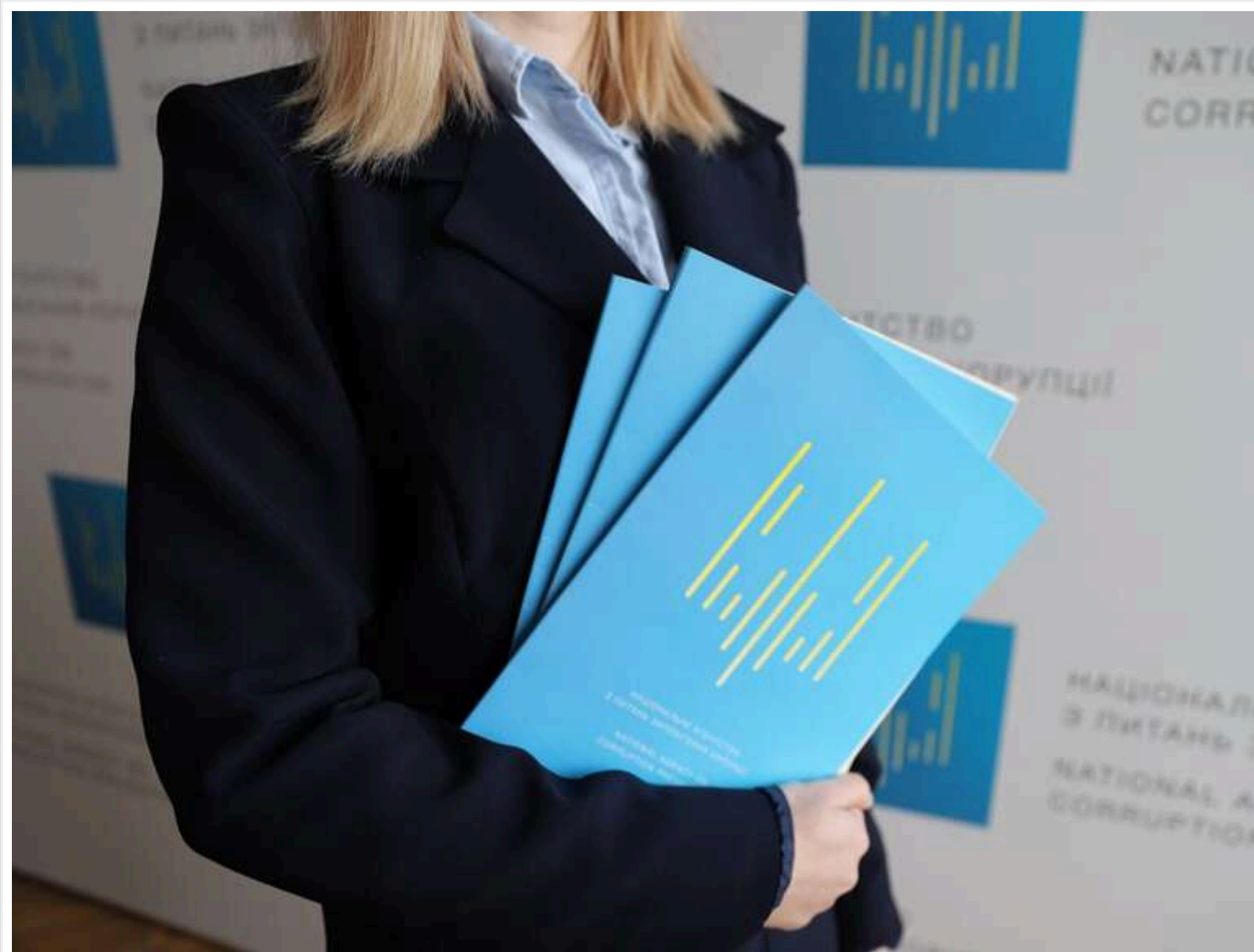
САП через суд вимагає конфіскувати елітний котедж заступниці начальника податкової Львівщини

Прокурор САП подав до Вищого антикорупційного суду позов про конфіскацію в дохід держави будинку та земельної ділянки, що належать заступнику начальника управління львівської податкової служби.