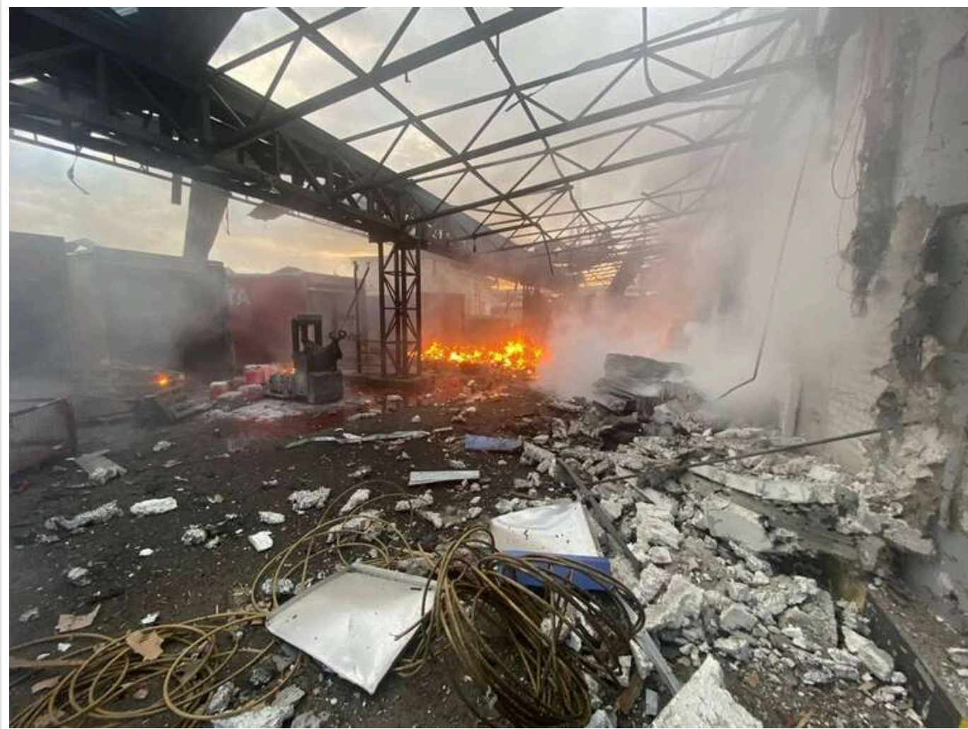
Російські війська тричі за добу вдарили по депо «Нової пошти» у Харкові: лунали нові вибухи

За добу росіяни тричі завдали ударів по депо №6 Нової пошти в Харкові.