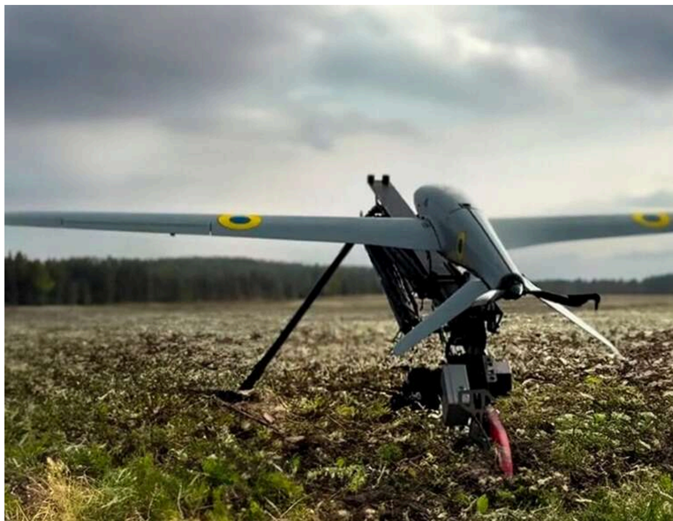
Пентагон хоче протестувати українські дрони та системи РЕБ перед заключенням контрактів, – Bloomberg

США планують протестувати українські дрони та системи РЕБ, а також отримати доступ до технологій – Bloomberg.