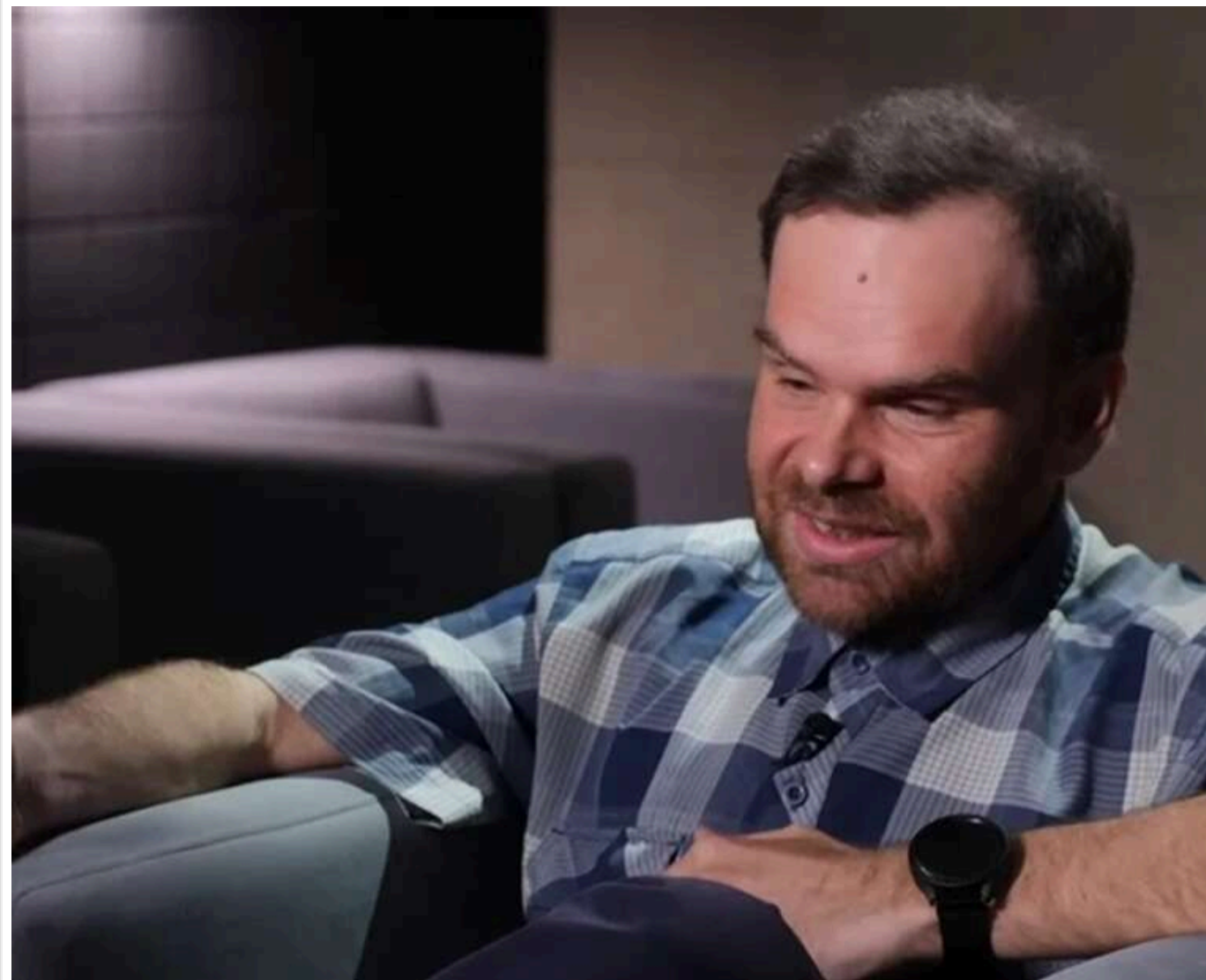
11-класники масово виїжджають за кордон: Доцент КНУ заявив про критичний недобір на технічні спеціальності