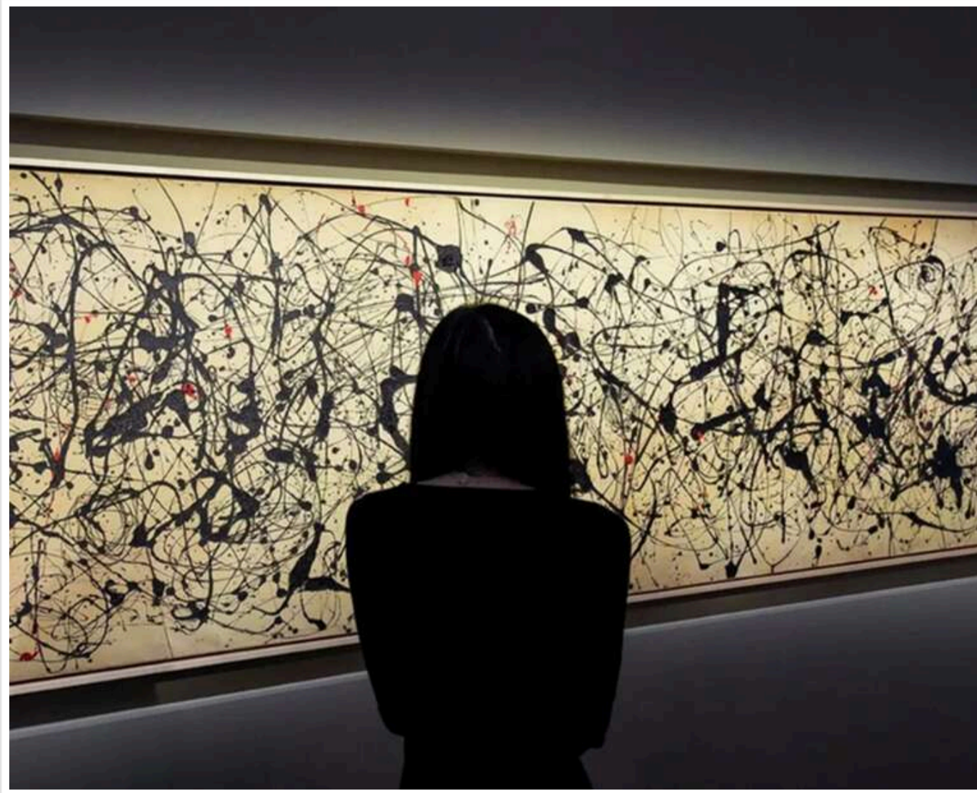
Три метри хаосу за 181 мільйон доларів: культова абстракція Поллока увійшла до п'ятірки найдорожчих картин в історії

Картину американського художника Джексона Поллока «Number 7A, 1948» реалізували на аукціоні в Нью-Йорку за рекордні 181 мільйон доларів.