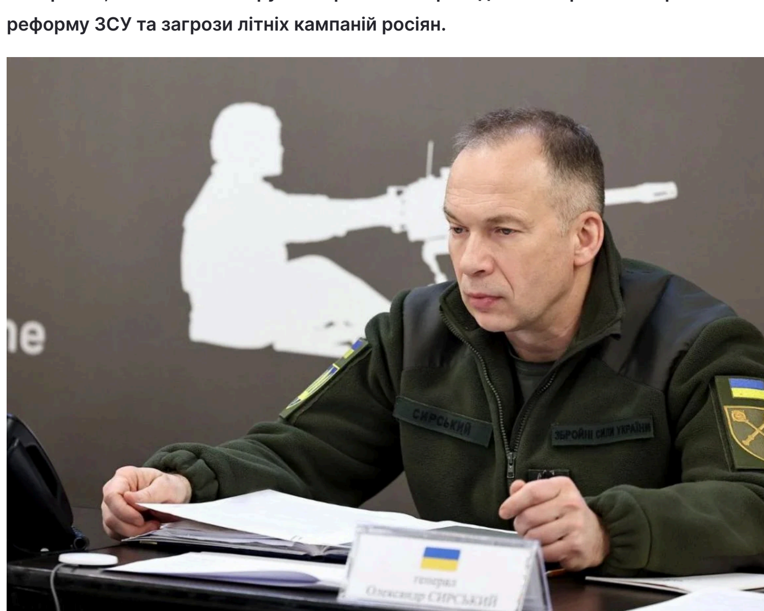
Сирський попередив про загрозу

Контракти, виплати та Білорусь: Сирський вперше детально розповів про реформу ЗСУ та загрози літніх кампаній росіян.