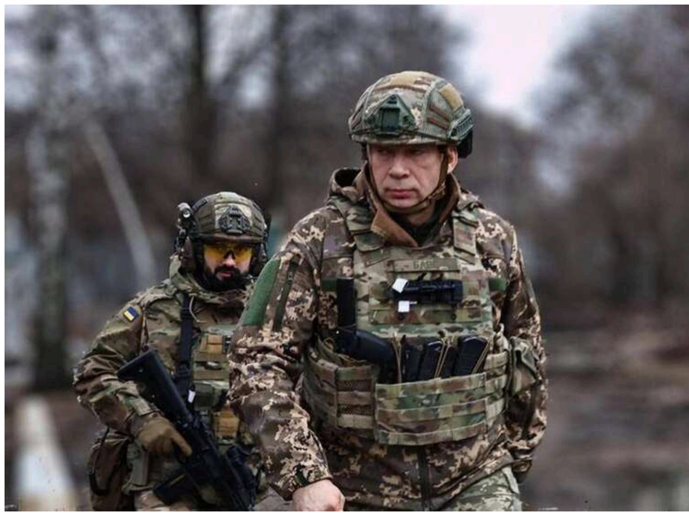
Короткі контракти від 6 місяців та зміни для новобранців: Сирський анонсував нові правила служби в ЗСУ

Головнокомандувач ЗСУ Сирський повідомив, що для військовослужбовців, комісійованих через поранення і бажаних повернутися на службу, введуть короткі контракти строком від 6 до 9 місяців.