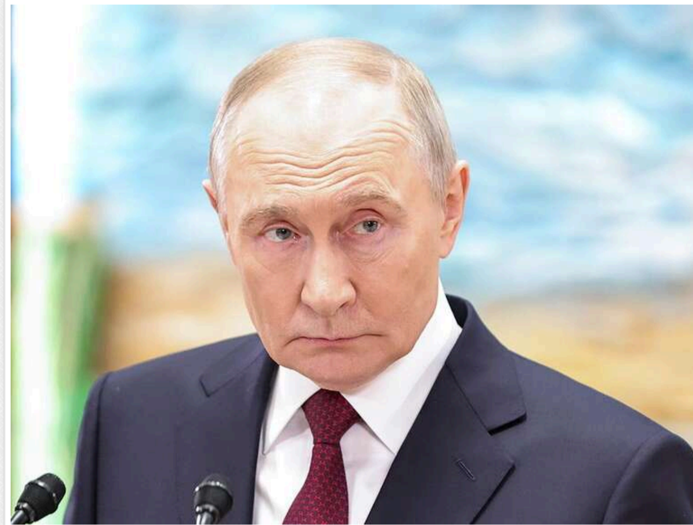
Сигнал тривоги для Кремля: The Telegraph оцінив здатність України атакувати Москву та НПЗ

Україна продемонструвала здатність завдавати ударів по найбільш захищеному місту Росії – Москві. Водночас тривають атаки на нафтопереробні заводи, трубопроводи та експортні термінали на глибині в кілька тисяч кілометрів усередині країни-агресора.