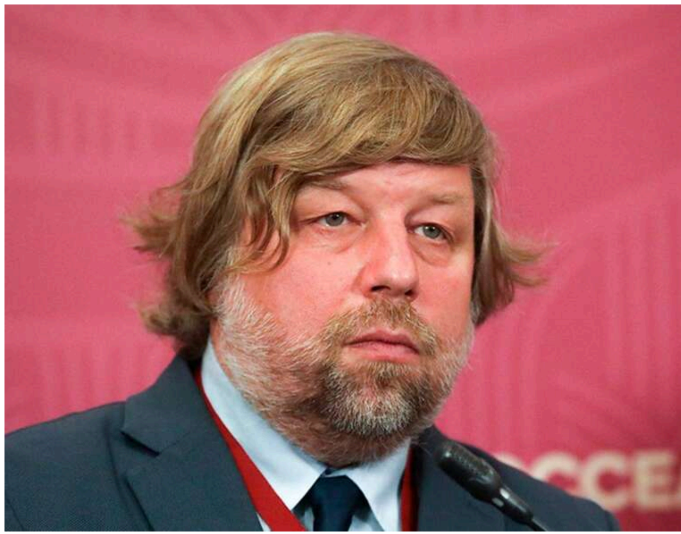
Попри підозру від України: російський археолог Бутягін заявив про намір продовжувати розкопки в окупованому Криму

Олександр Бутягін заявив, що планує продовжити археологічні розкопки на території тимчасово окупованого Криму, попри кримінальне переслідування з боку України.