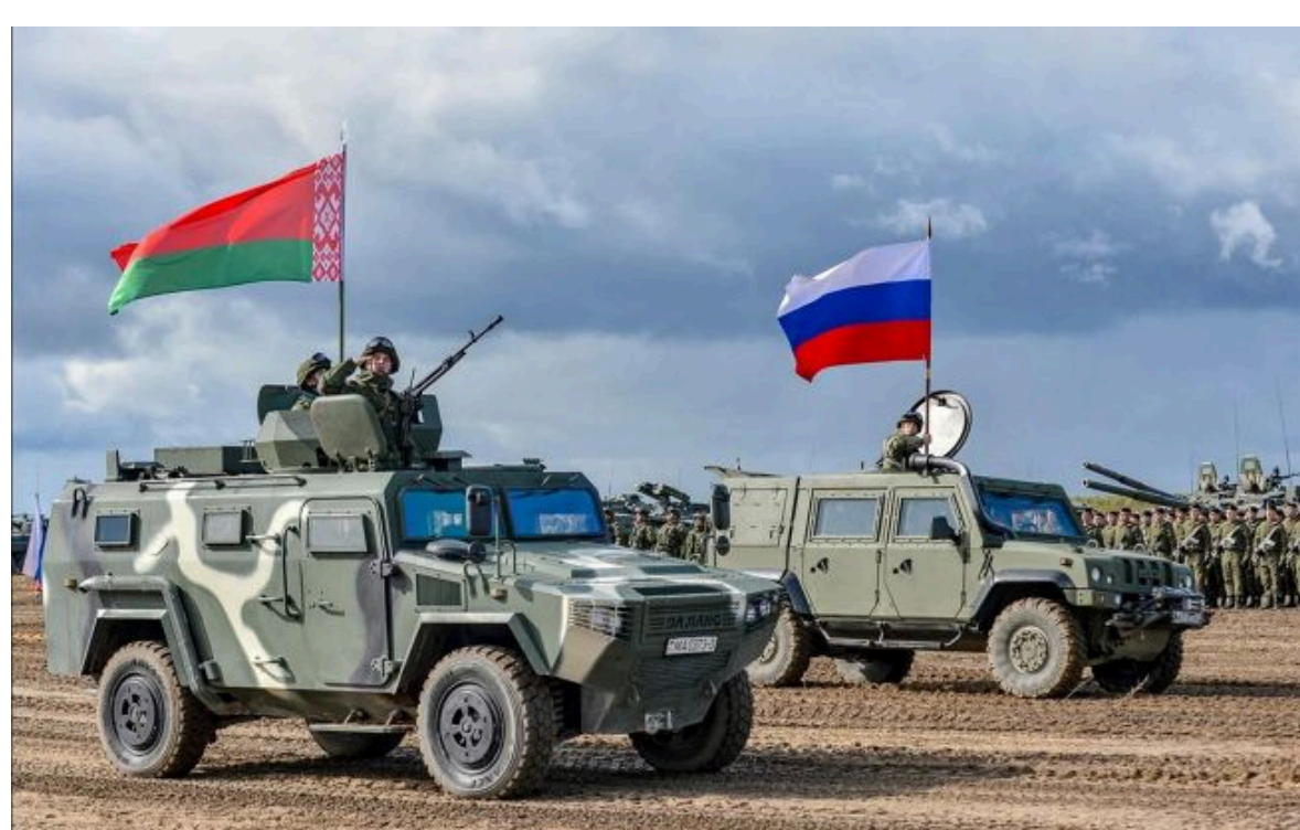
Фото: чи готується Білорусь до нападу на Україну