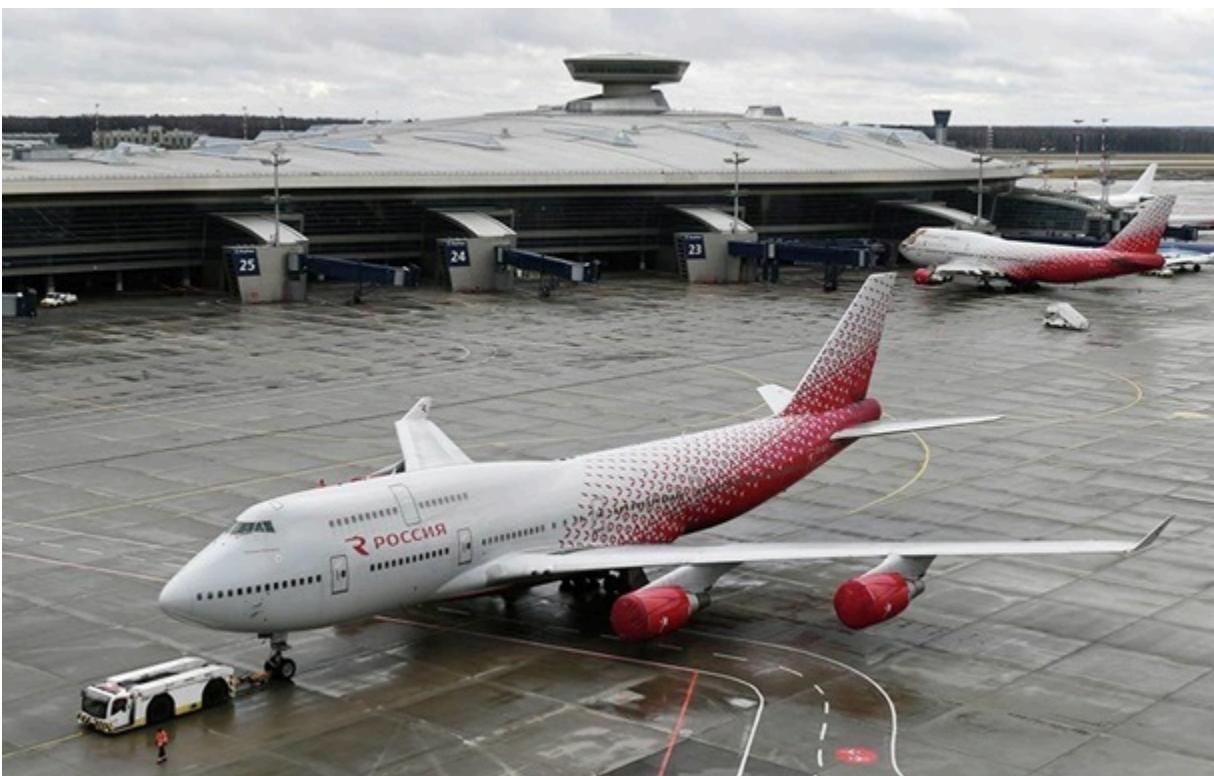
Фото: Аерофлот Росія продовжує завозити літаки Airbus в обхід санкцій

Американська GA Telesis, котра фігурує в ланцюжку володіння літаком, раніше активно працювала на російському ринку, проте після початку війни постала перед неможливістю повернути свої активи з Росії.