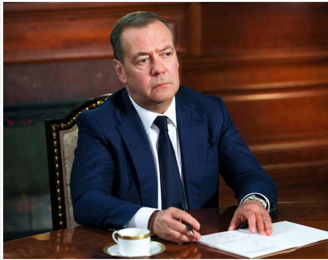
Медведєв вибухнув лайкою на адресу міністрів країн Балтії та закликав НАТО застосувати 5-ту статтю проти України

Експрезидент Росії та нинішній заступник голови Ради безпеки РФ Дмитро Медведєв заявив, що країни Балтії могли б ініціювати застосування п'ятої статті НАТО проти України.