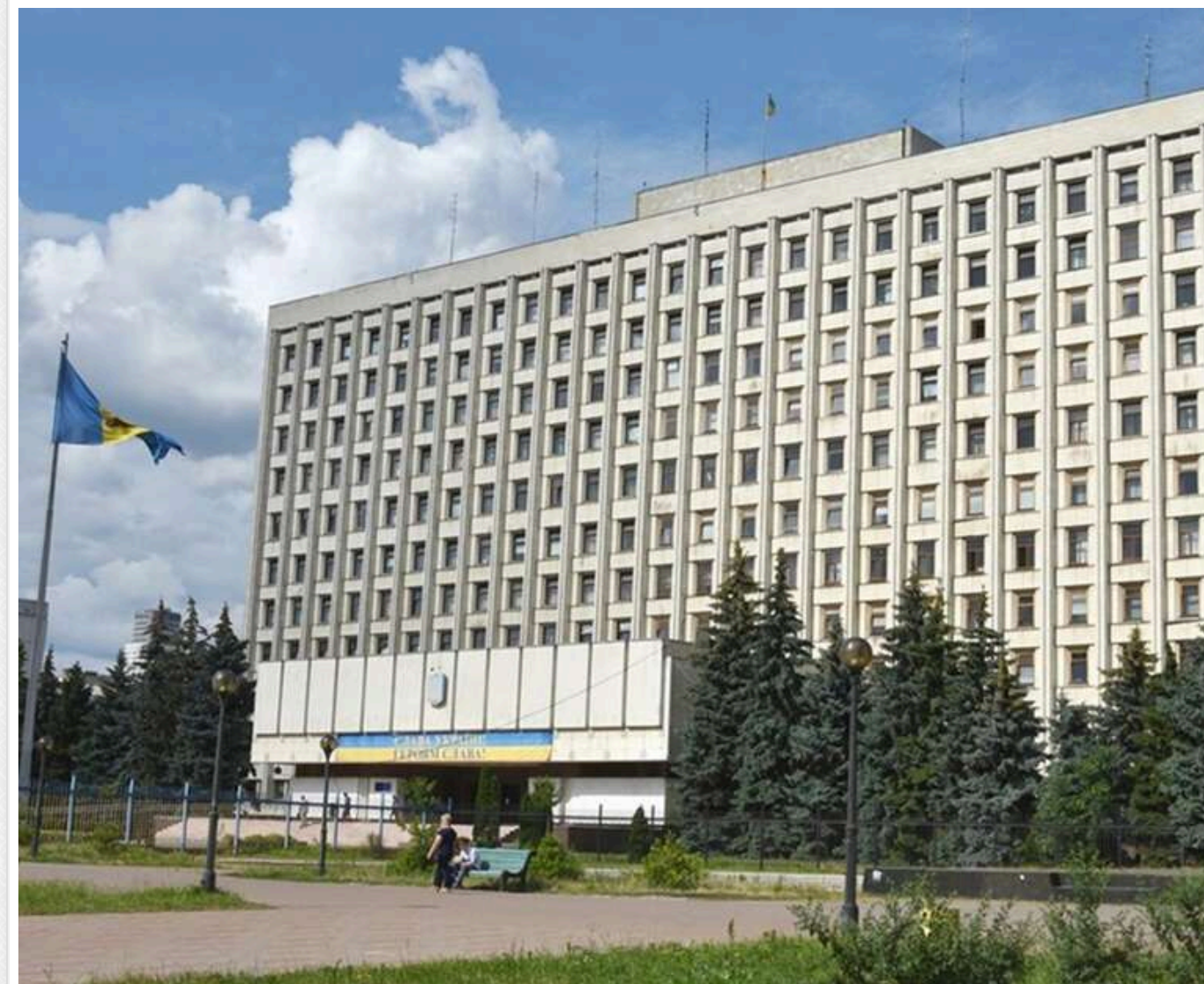
Прикривалися КОВА: на Київщині шахраї виманоють гроші у бізнесу «на потреби ЗСУ»

На Київщині виявили нову шахрайську схему виманювання коштів у бізнесу та громадських організацій. Зловмисники, видаючи себе за Київську обласну державну адміністрацію, розсилають фальшиві листи та телефонують керівникам підприємств із вимогою терміново переказати гроші нібито на потреби Сил оборони України. Для більшої переконливості аферисти використовують ім'я начальника Київської ОВА та членів його команди.