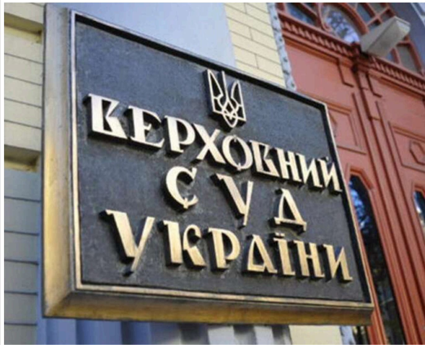
Обшуки та підозри у Верховному Суді: стали відомі імена чотирьох суддів, які фігурують у справі Князева-Жеваго

Читати на руськом Read in English Додати як бажане джерело в Google