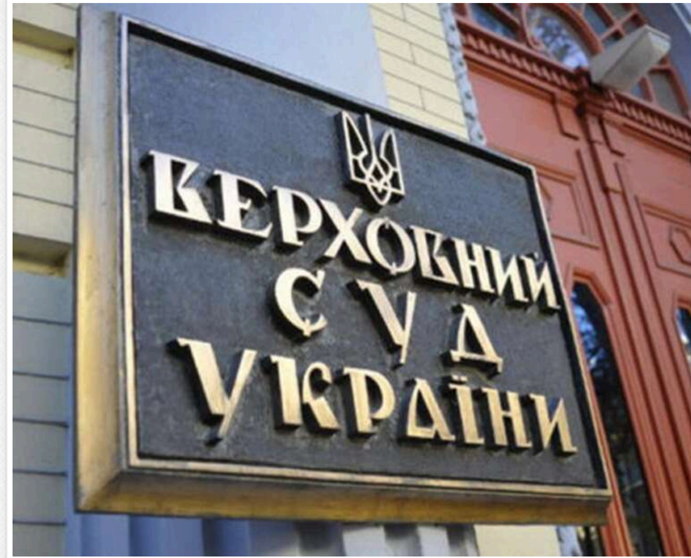
Обшуки та підозри у Верховному Суді: стали відомі імена чотирьох суддів, які фігурують у справі Князева-Жеваго

Читати на руском Read in English Додати як багаторічне джерело в Google