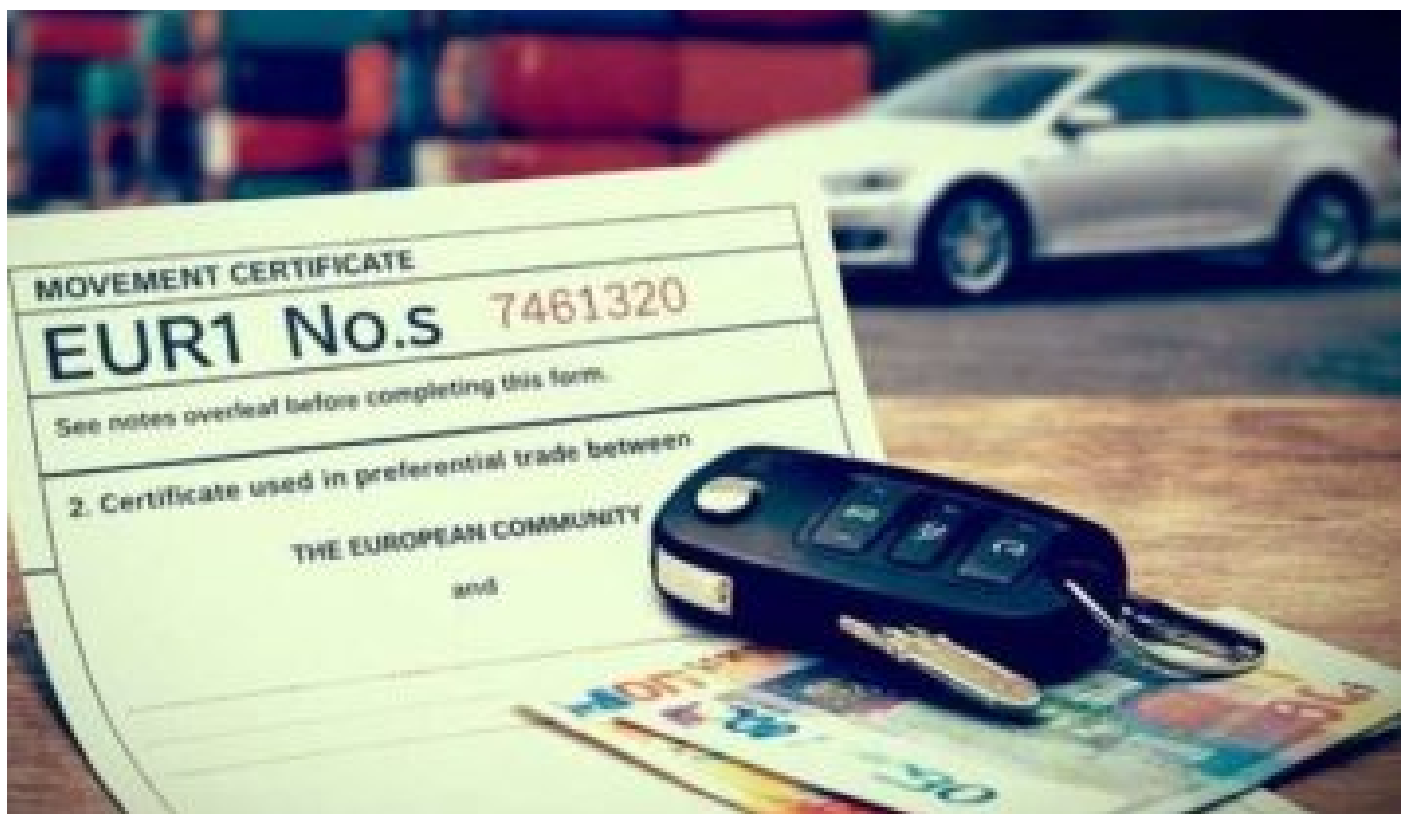
Фальшиві сертифікати та мільярдне втрати: новий скандал на митниці