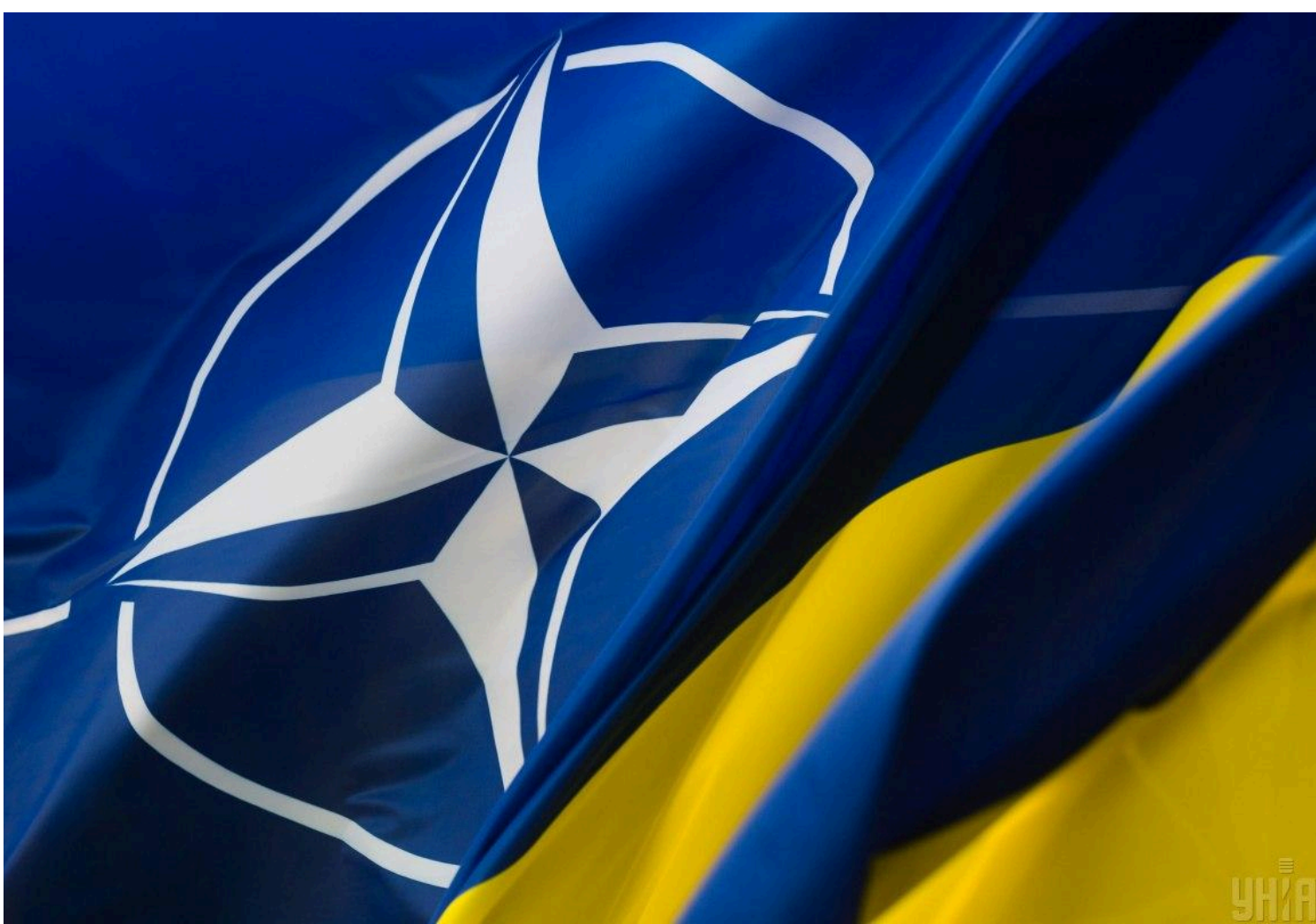
НАТО переформатується

Генерал Грінкевич заявив, що рішення США не загрожують планам НАТО, постачання в Україну тривають, а союзники беруть на себе більшу відповідальність.