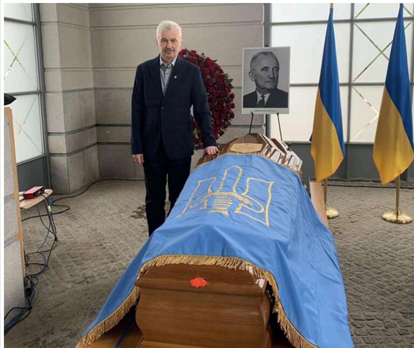
У Люксембурзі ексгумували прах другого голови ОУН Андрія Мельника для перезахоронення в Україні

В Україну планують перевезти прах одного з головних опонентів Степана Бандери в Організації українських націоналістів.