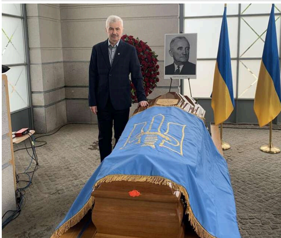
У Люксембурзі ексгумували прах другого голови ОУН Андрія Мельника для перезахоронення в Україні

В Україну планують перевезти прах одного з головних опонентів Степана Бандери в Організації українських націоналістів.