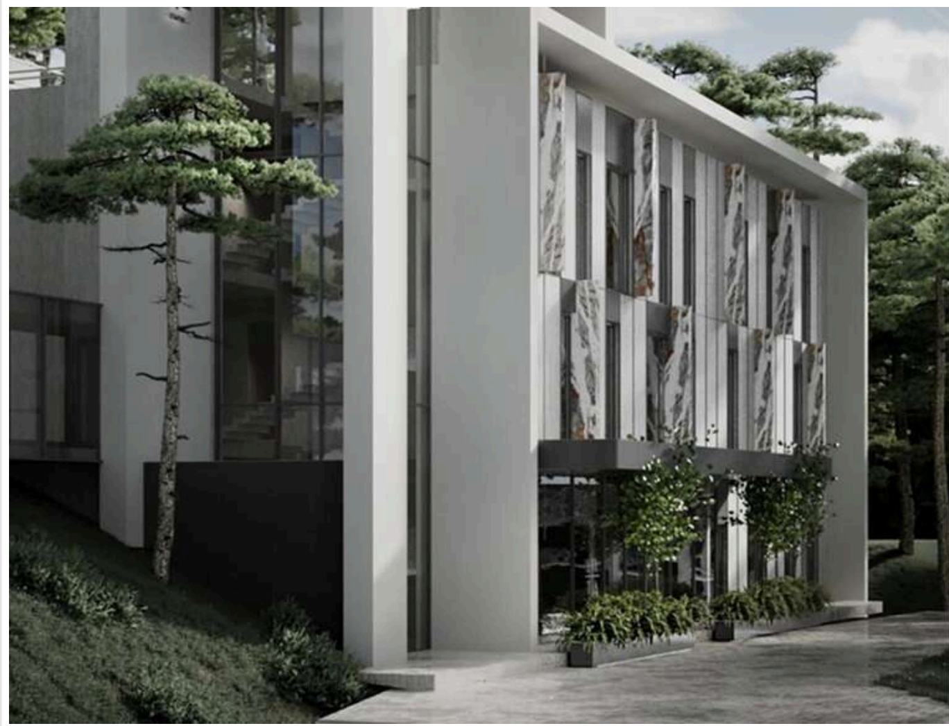
Схема з ФОП та готівкою: відому клініку пластичної хірургії Lita Plus підозрюють у приховуванні доходів

БЕБ і прокуратура розслідують можливе ухилення від сплати податків (ч. 3 ст. 212 ККУ) медичним центром пластичної хірургії в Ужгороді.