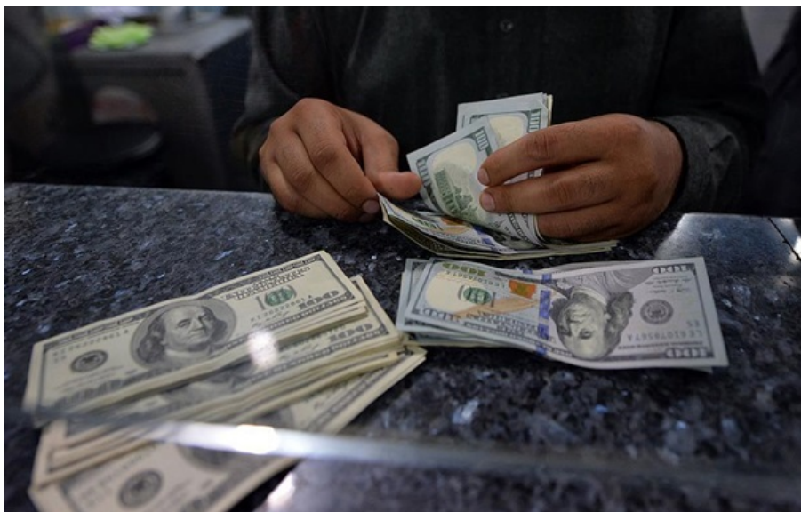
Обмінники купують долар у середньому по 43,49 гривні

Середній курс продажу долара впав до 43,60 гривні, а курс продажу євро знизився до 50,69 гривні.