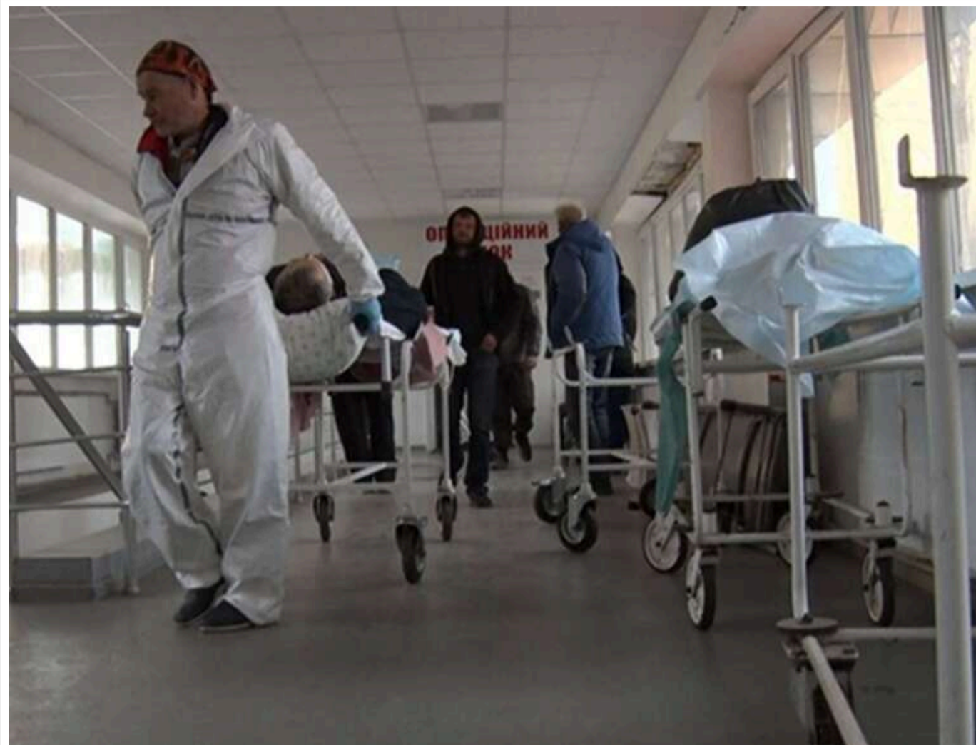
Через наплив поранених у РФ закривають пологові будинки та віддають цивільні лікарні під госпіталі, — росЗМІ

Військові госпіталі країни-агресора Росії вже не справляються зі стрімким зростанням кількості поранених на війні проти України.