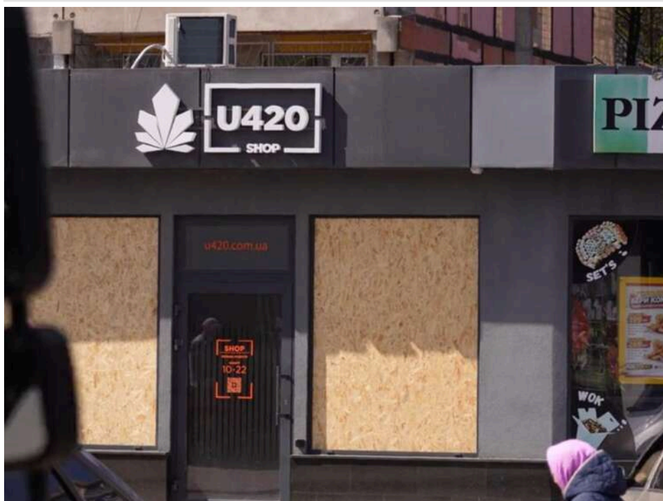
Юристи намагаються в суді оскаржити постанову Кабміну про заборону U420