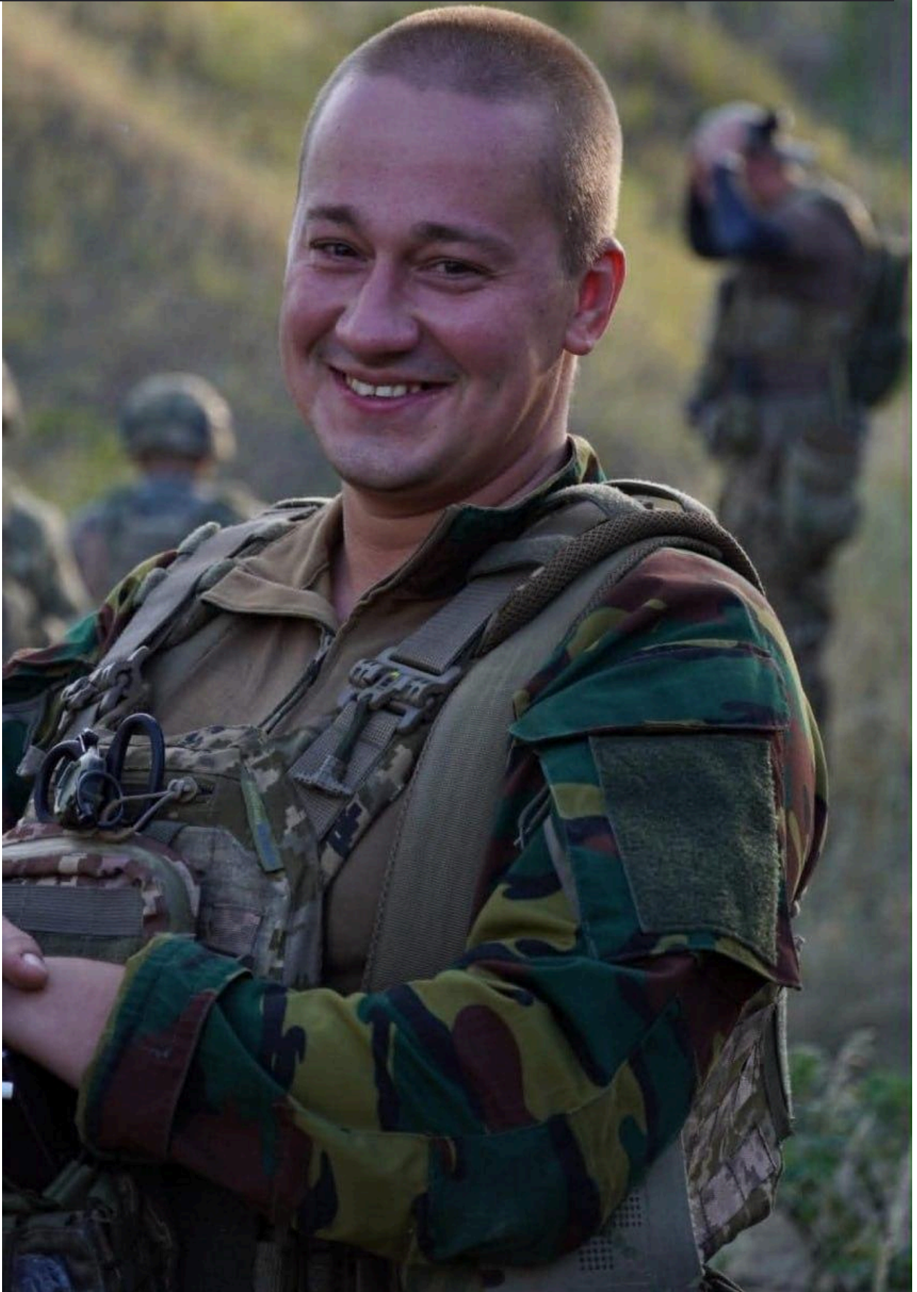
Піхотинець у полоні спав по 15-20 хвилин