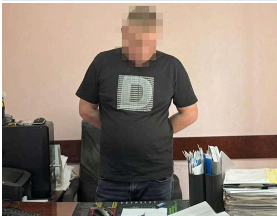
На Львівщині затримали посадовця «Укрзалізниці»: вимагав 95 тисяч гривень за підключення до електромереж

На Львівщині затримали начальника лінійного відділу підрозділу «Енергозбут» АТ «Укрзаліниця». Його підозрюють у вимаганні неправомірної вигоди. За версією слідства, посадовець пообіцяв підприємцю за 95 тисяч гривень вплинути на позитивне рішення про підключення до електромереж, а в разі відмови – штучно затягнути процес.