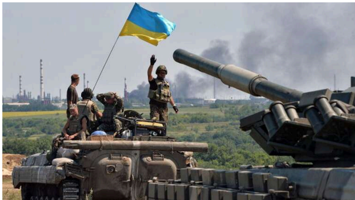
Ситуація на фронті: Зафіксовано 63 атаки від початку доби, найзапекліші бої тривають на Покровському напрямку

З початку доби 19 травня 2026 року російські війська 63 рази штурмували позиції Сил оборони України.