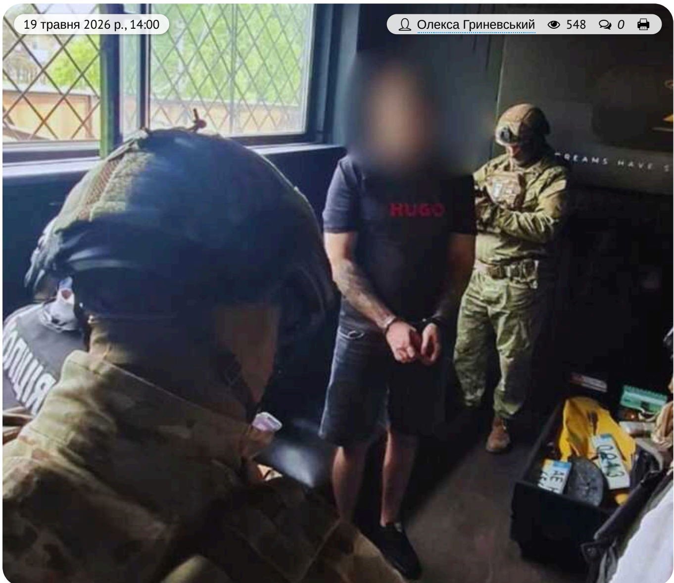
У Києві викрили схему переправлення ухилянтів за 25 тисяч доларів через фіктивну інвалідність