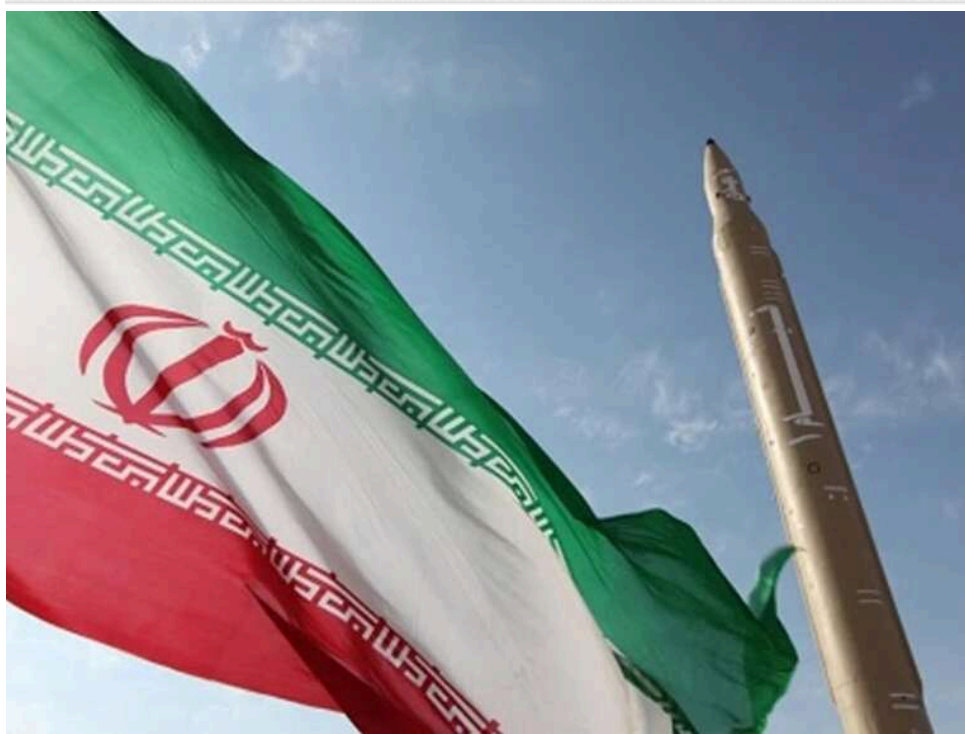
Ціна поступок – 20 мільярдів доларів: Іран вимагає розмороження активів в обмін на обмеження ядерної програми