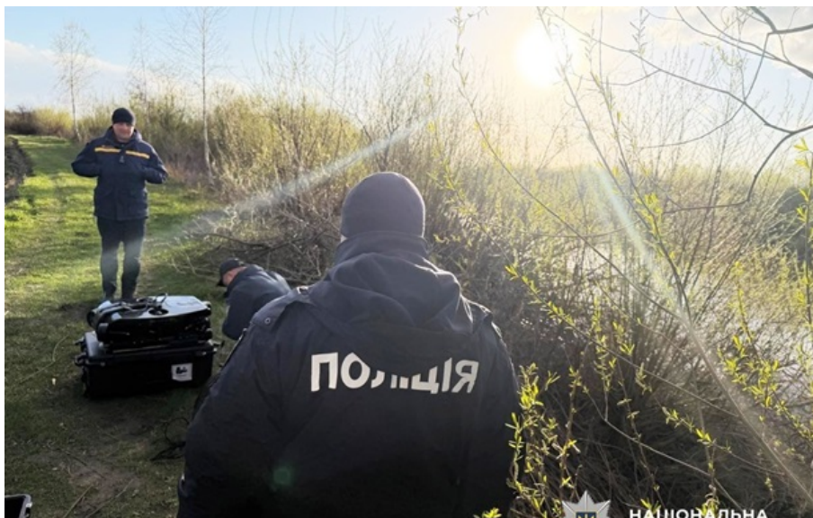
На Рівненщині тривають пошуки дитини

Спільно з небайдужими правоохоронці оглядають закинуті господарства, криниці, чагарники.