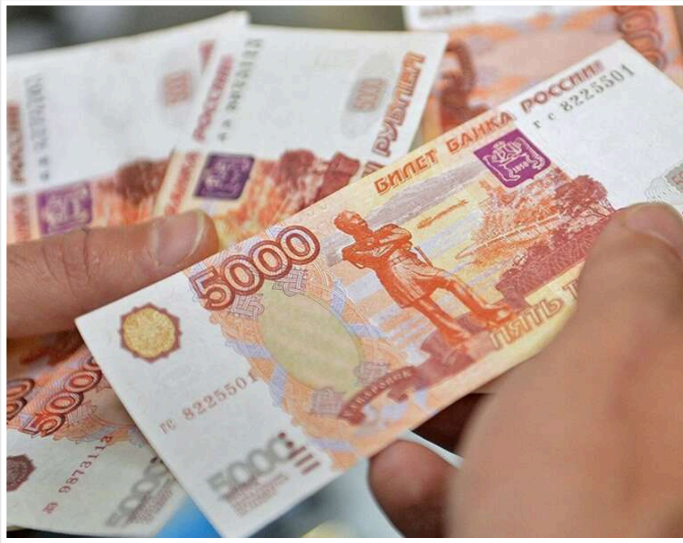
Рубль став лідером зростання до долара в цьому кварталі та зміцнився до 70 за долар, - Bloomberg

За даними Bloomberg, російський рубль у поточному кварталі продемонстрував найкрашу динаміку серед світових валют стосовно долара.