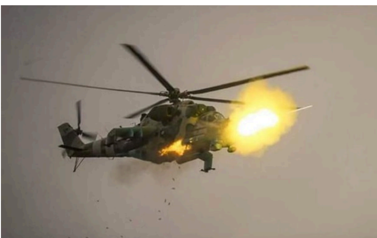
ЗСУ відбивають атаки росіян на 10 напрямках

Більше половини російських атак зосереджено в районах Покровська і Гуляйполя. Там ЗСУ відбивають штурми в районах 17 населених пунктів.