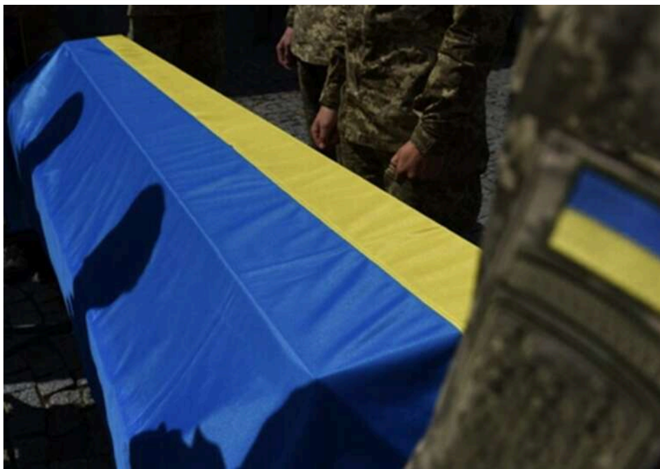
Повернулися на рідну землю «на щиті»: Чернігівщина прощається зі своїми захисниками

У громадах Чернігівщини прощались із захисниками, які загинули на російсько-українській війні.