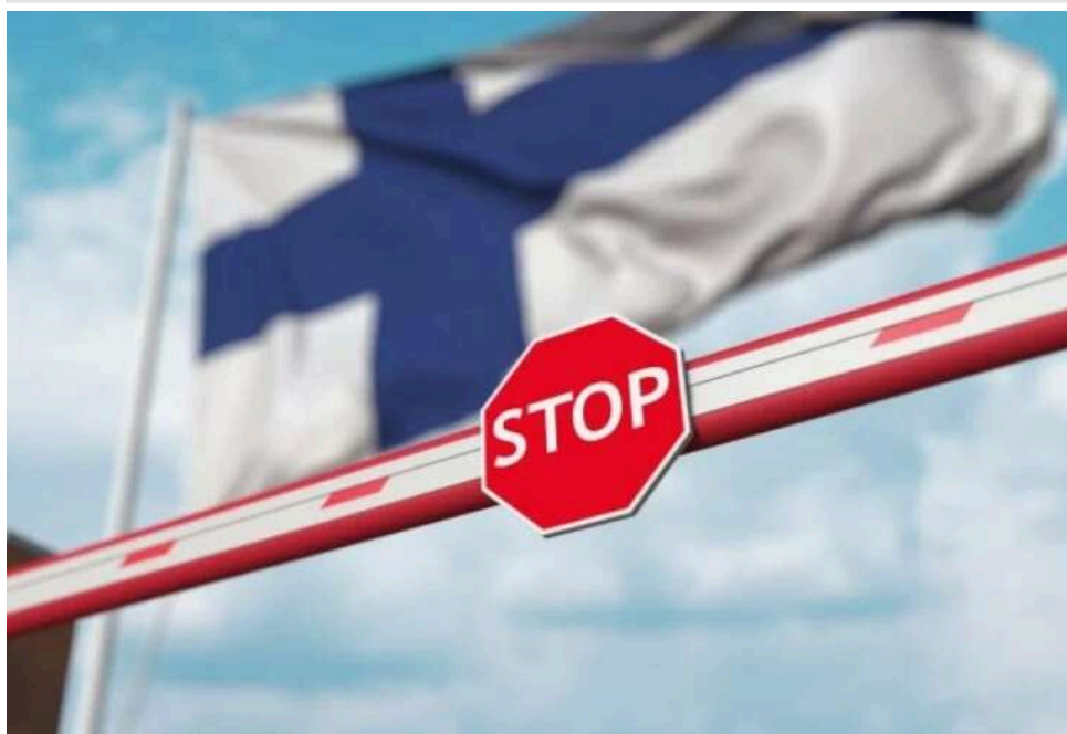
Фінляндія залучає резервістів для посилення охорони кордонів і моніторингу території