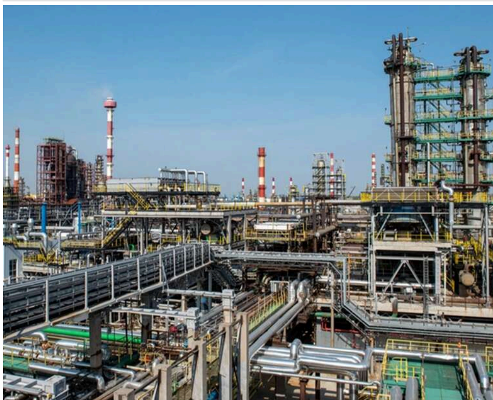
Генштаб ЗСУ заявив про ураження НПЗ та нафтоперекачувальної станції в районі Ярославля

Генеральний штаб ЗСУ повідомив про ураження нафтопереробного заводу та нафтоперекачувальної станції в районі російського Ярославля.