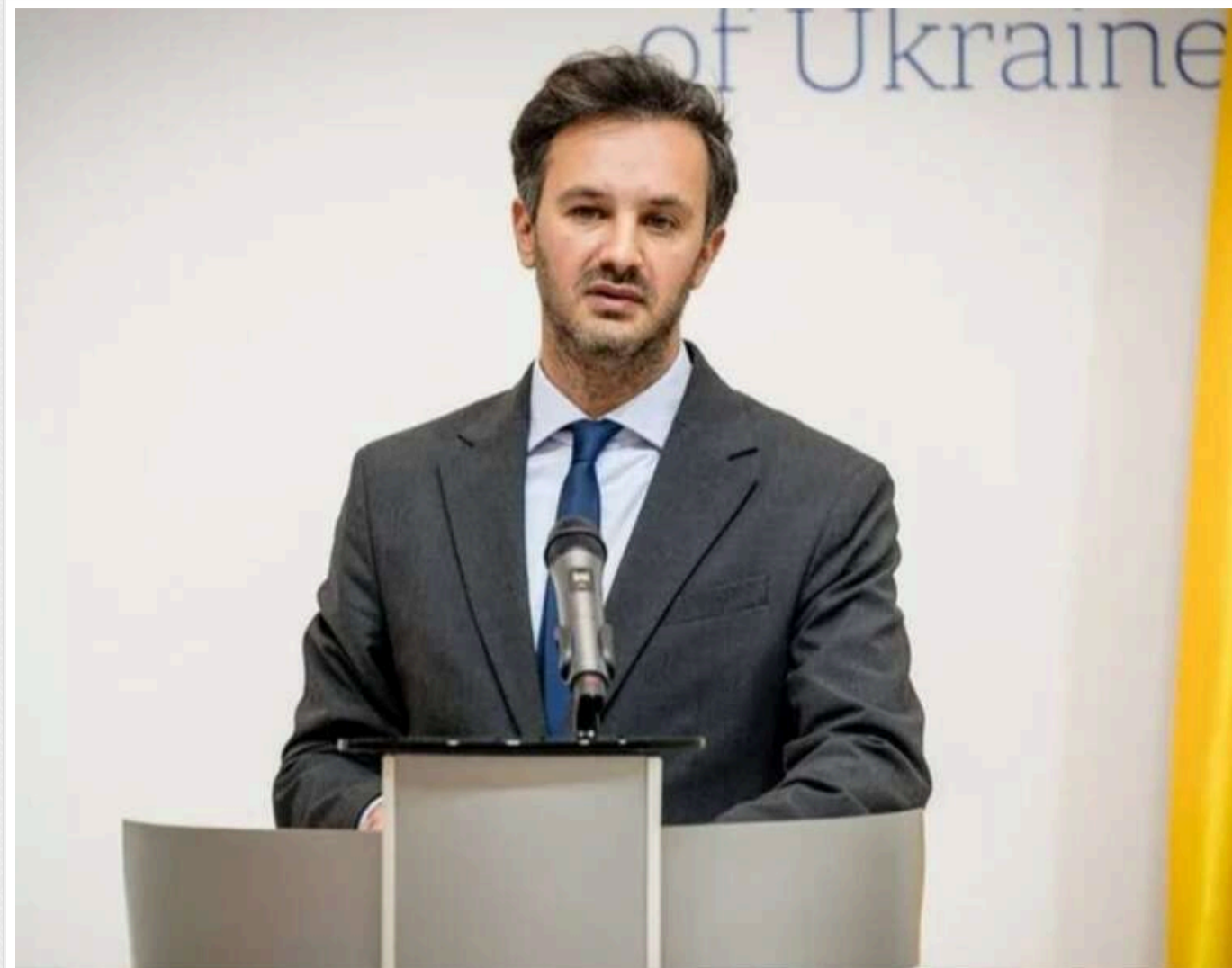
«Росія бреше»: Рінкевичс та МЗС України відкинули звинувачення Кремля щодо використання Латвії для атак

Київ і Рига спростували фейк РФ про використання повітряного простору Латвії для ударів.