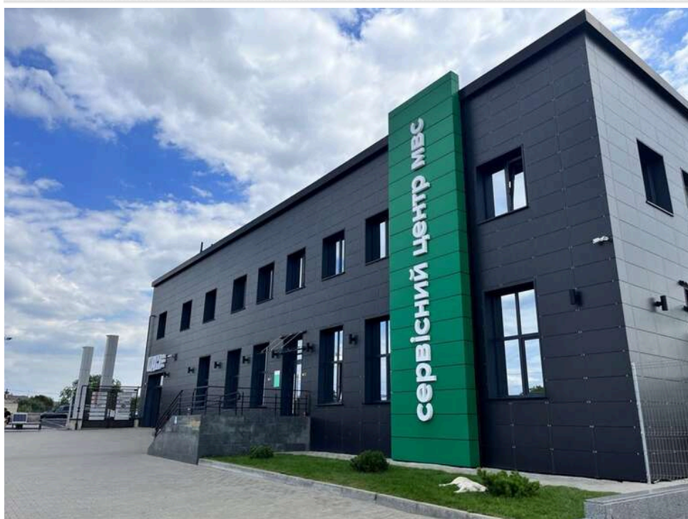
Техогляд у месенджері та «сліпе» МВС: як ТОВ «ЛТК «МІР» монополізувало ринок фіктивних перевірок для несправних фур