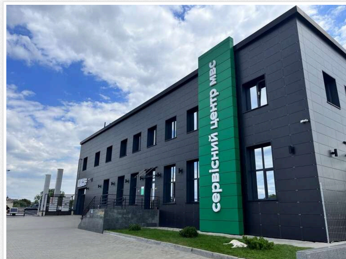
Техогляд у месенджері та «сліпе» МВС: як ТОВ «ЛТК «МІР» монополізувало ринок фіктивних перевірок для несправних фур