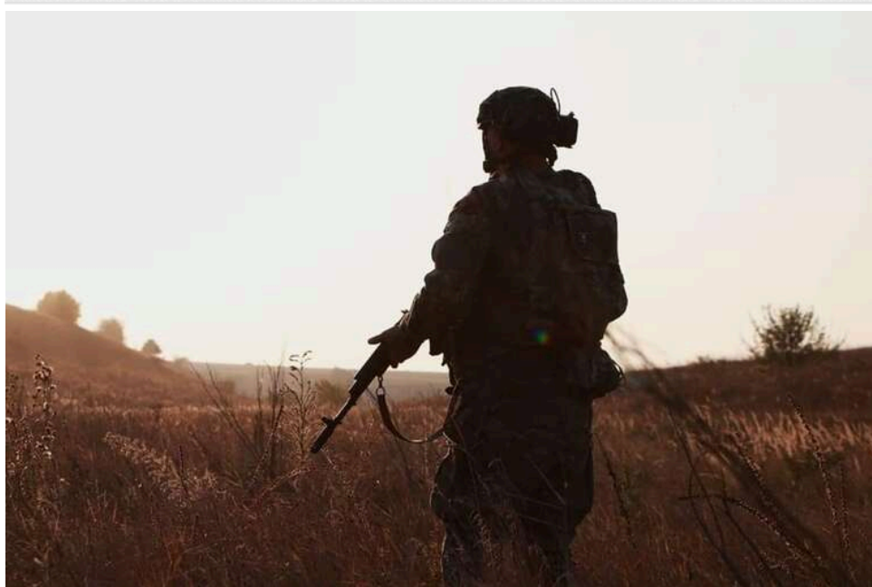
«Кишеня» стає пасткою: у ЗСУ заявили про загрозу оточення на північних околицях Покровська